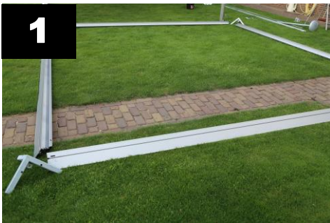
1 Leg de liggers (4x) en hoekstukken (4x) op de grond.