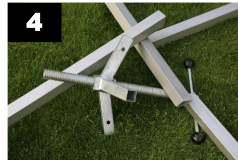
4 Leg de dak onderdelen op de grond. Dakliggers (4x) en draadspindel (1x)