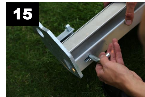
15 Borg de voetplaten & hoekstaanders met de ronde borgpennen (4x).