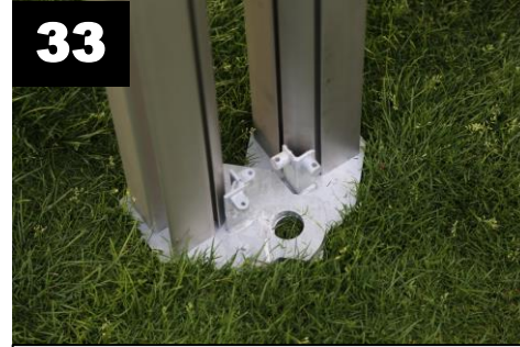
33 Voetplaten van de tenten over elkaar plaatsen. Met pin vastzetten.