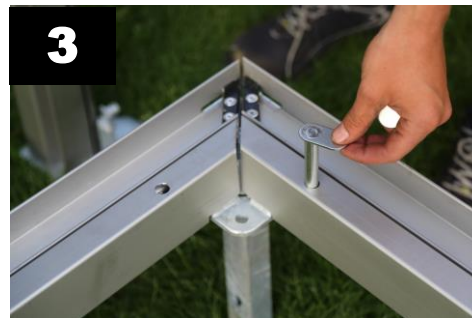
3 Borg de hoeken & liggers met de platte borgpennen (8x)