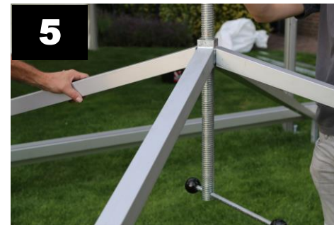
5 Schuif de draadspindel in de dakliggers.