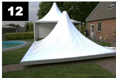
12 Via draadspindel dakzeil spannen.