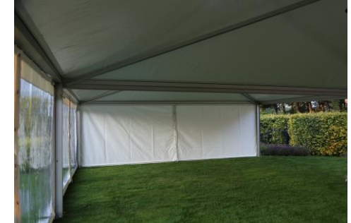
2,3 of 4 pagodetenten gekoppeld, in lijn, vierkant of L-vorm.