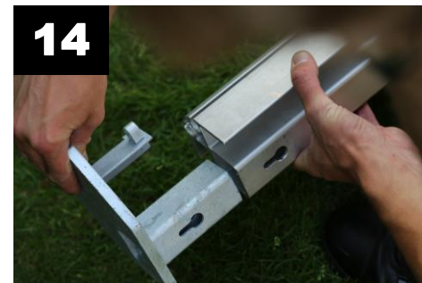
14 Installeer de voetplaten (4x) in de hoekstaanders (4x).