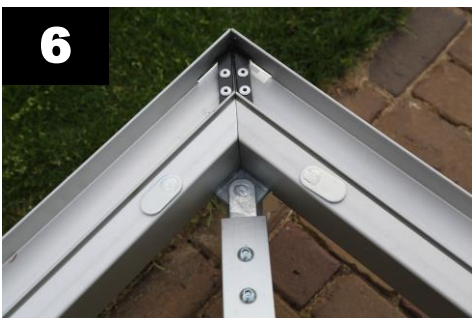
6 Plaats de dakliggers in de hoekstukken (4x).