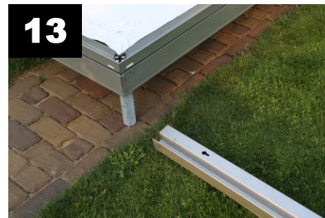
13 Leg de hoekstaanders (4x) op de grond.