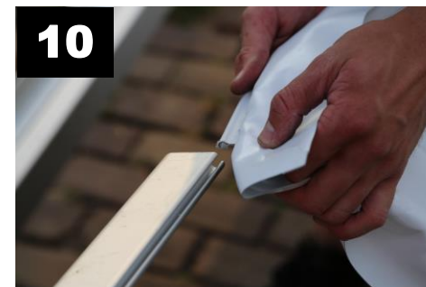
10 Dakzeil kanten (4x) door dakspanprofielen schuiven (8x).