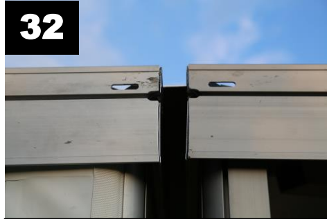
32 Plaats u profiel over dakliggers van 2 pagodetenten.