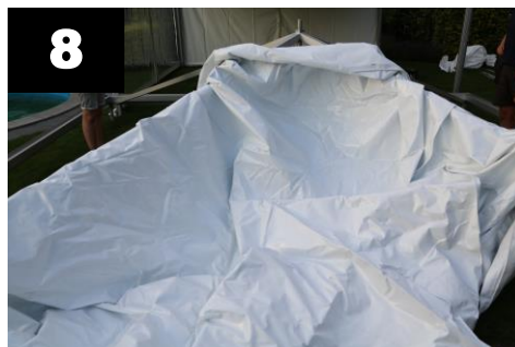
8 Let op uitstekende draadspindel. Dakzeil over heen tillen, zodat het niet beschadigd.