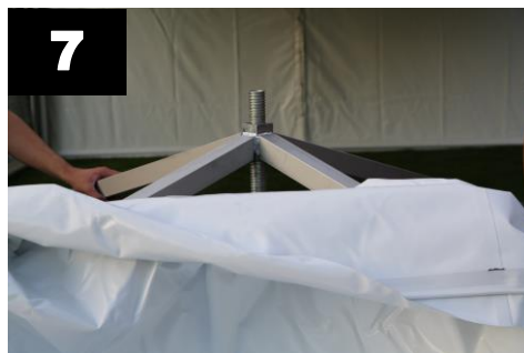
7 Leg het dakzeil over de dakliggers.