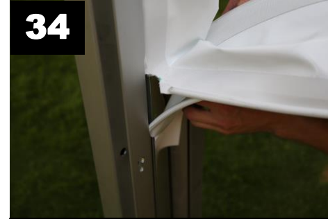
34 Installeer afdichting. Schuif rand van afdichting tussen in hoekstaanders.