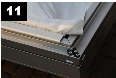
11 Dakspanprofielen (8x) aan liggers vastmaken (klikken). Zorg dat ze op de hoeken niet over elkaar liggen.