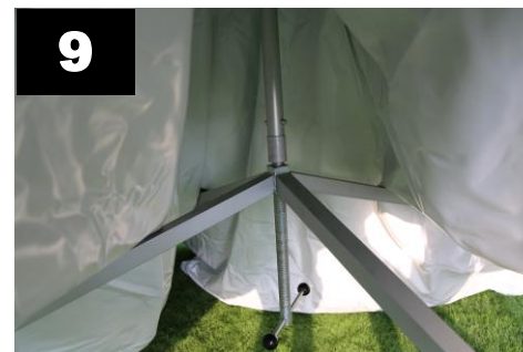
9 Dakstaander over de draadspindel plaatsen.