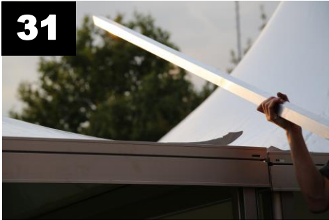
31 Plaats u profiel over dakliggers van 2 pagodetenten.